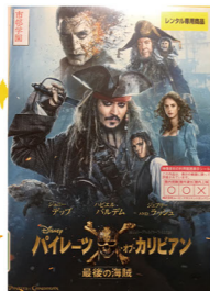
②パイレーツ・オブ・カリビアン / 最後の海賊